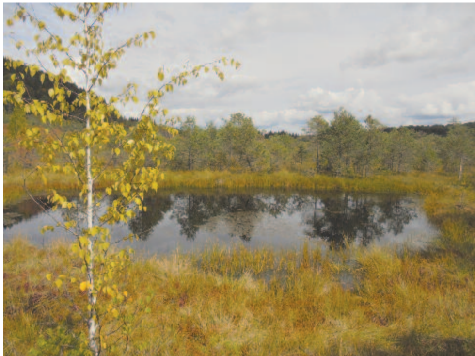
Mohos láp – szelíd kék, hűvös szürke, súlyos sárga