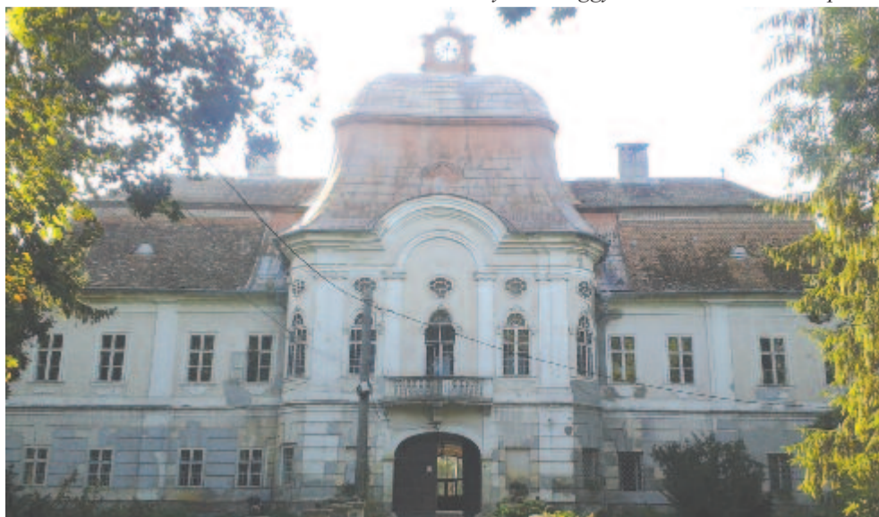
A geryeszegi Teleki-kastély

3 https://hu.wikipedia.org/wiki/Teleki_Domokos_(történész) ; Forrás: Szinyei József (1909)