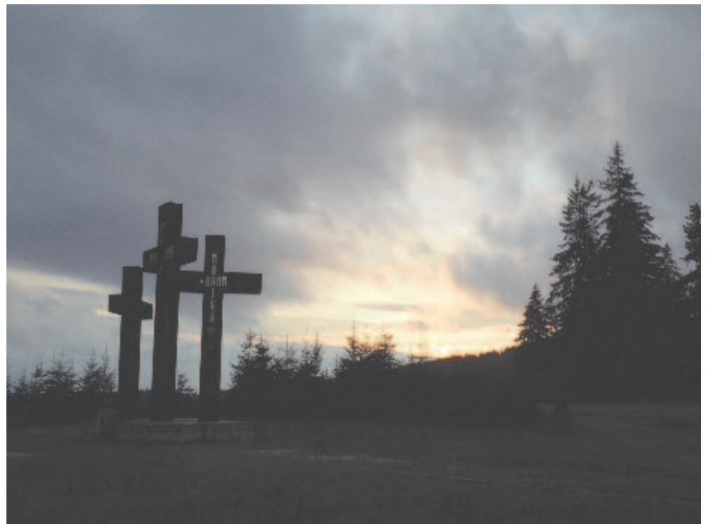
Tolvajos tető – érzeim próbálják utolérni az időt, mely kihúzódik a láthatárból